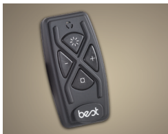
Le cuisinier le plus occupé peut faire fonctionner la hotte de partout dans la cuisine grâce à la télécommande ACR3 en option.