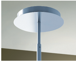
Tige télescopique convenant aux plafonds de 8 à 9 pi.