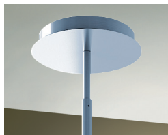
Telescopic rod accommodates ceiling heights 8' to 9'.