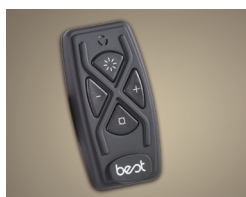
Optional ACR3 remote control lets the busy cook stay in control from anywhere in the kitchen.